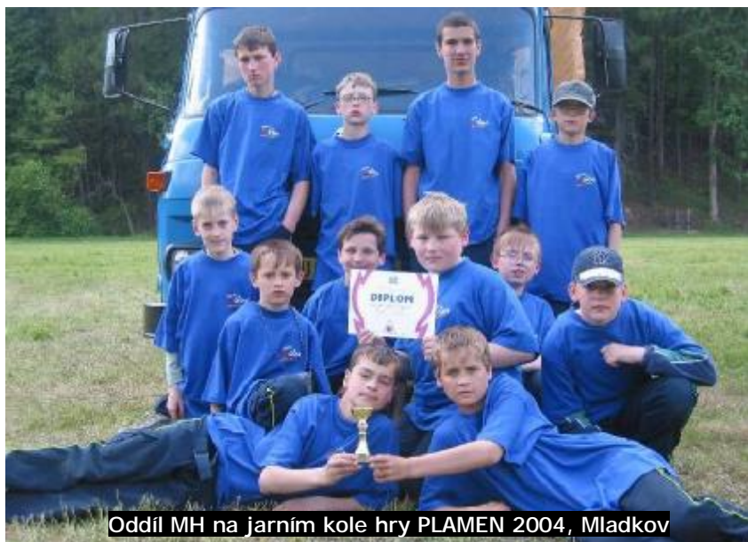
Oddíl MH na jarním kole hry PLAMEN 2004, Mladkov