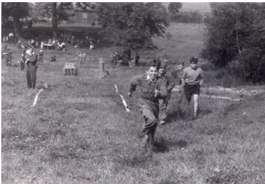
Žáci při cvičení (rok 1958)