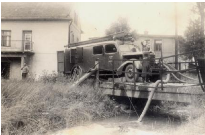
Druhý zásahový automobil sboru (námětové cvičení 1966)