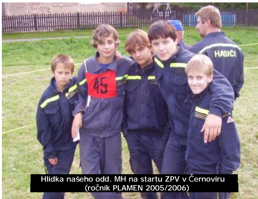
Hlídkva našeho odd. MH na startu ZPV v Černoviru (ročník PLAMEN 2005/2006)