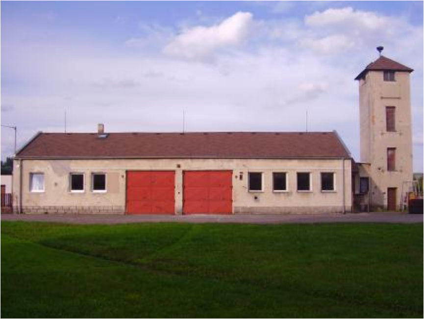
Stávající zbrojnice sboru postavená v letech 1956 – 1963 svépomocí

občanů, kteří odpracovali 462 hodin. Nová zbrojnice včetně věže na sušení hadic byla dokončena v r. 1963.