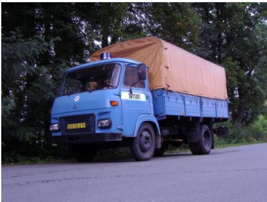
Současný zásahový automobil sboru Avia A31