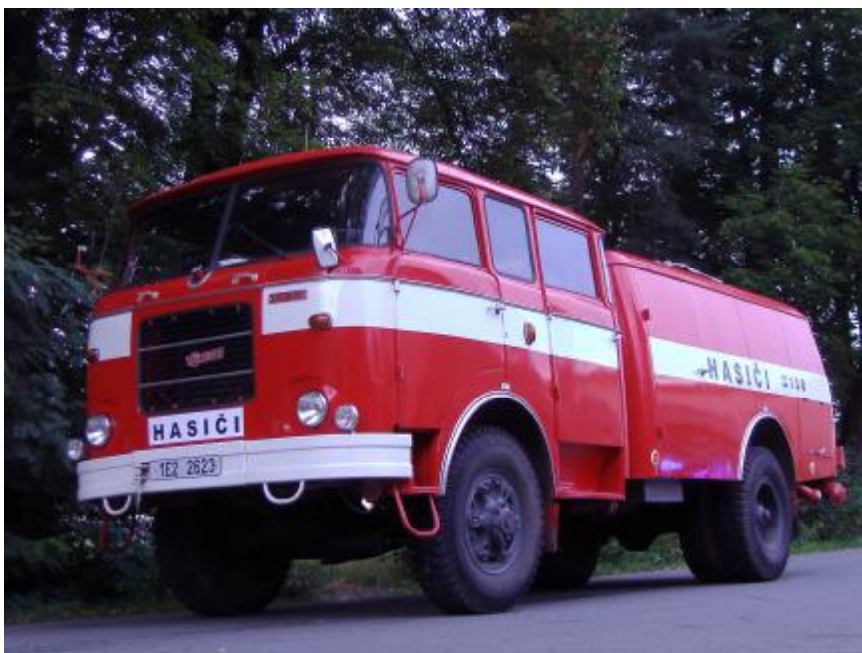
Nový zásahový automobil CAS25 Š706 RTHP

Po provedeném preventivním ošetření cisterny proti korozi, které je již dokončeno a po vybavení spojovou technikou bude v nejbližší době vozidlo zařazeno do výjezdu.