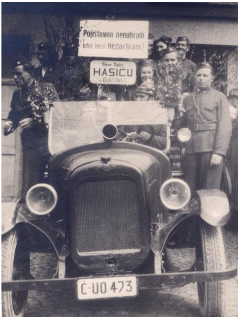
První zásahové vozidlo převzaté po německém sboru