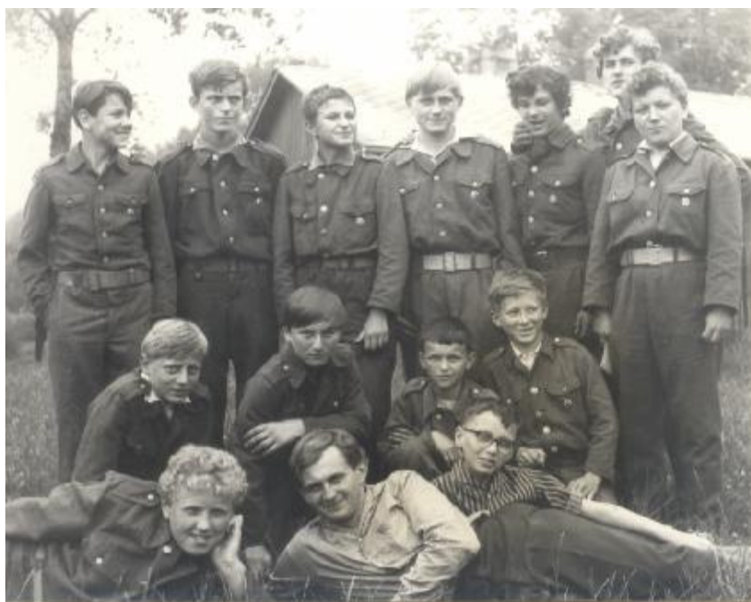
Obvodové kolo PD 8.6.1968 Letohrad