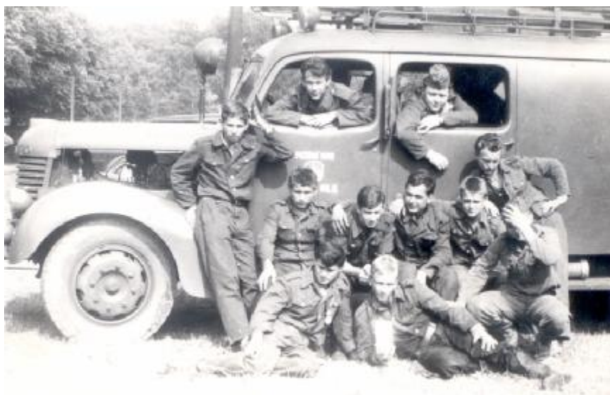
Celostátní soutěž PD 1959 (žáci i dorost 1. místo)